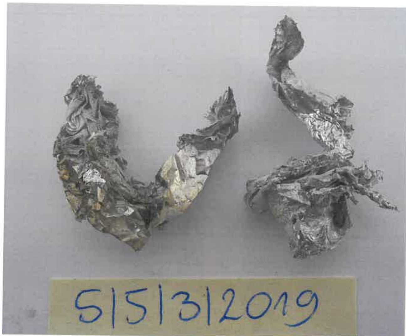
Rys. 2. Folia aluminiowa.