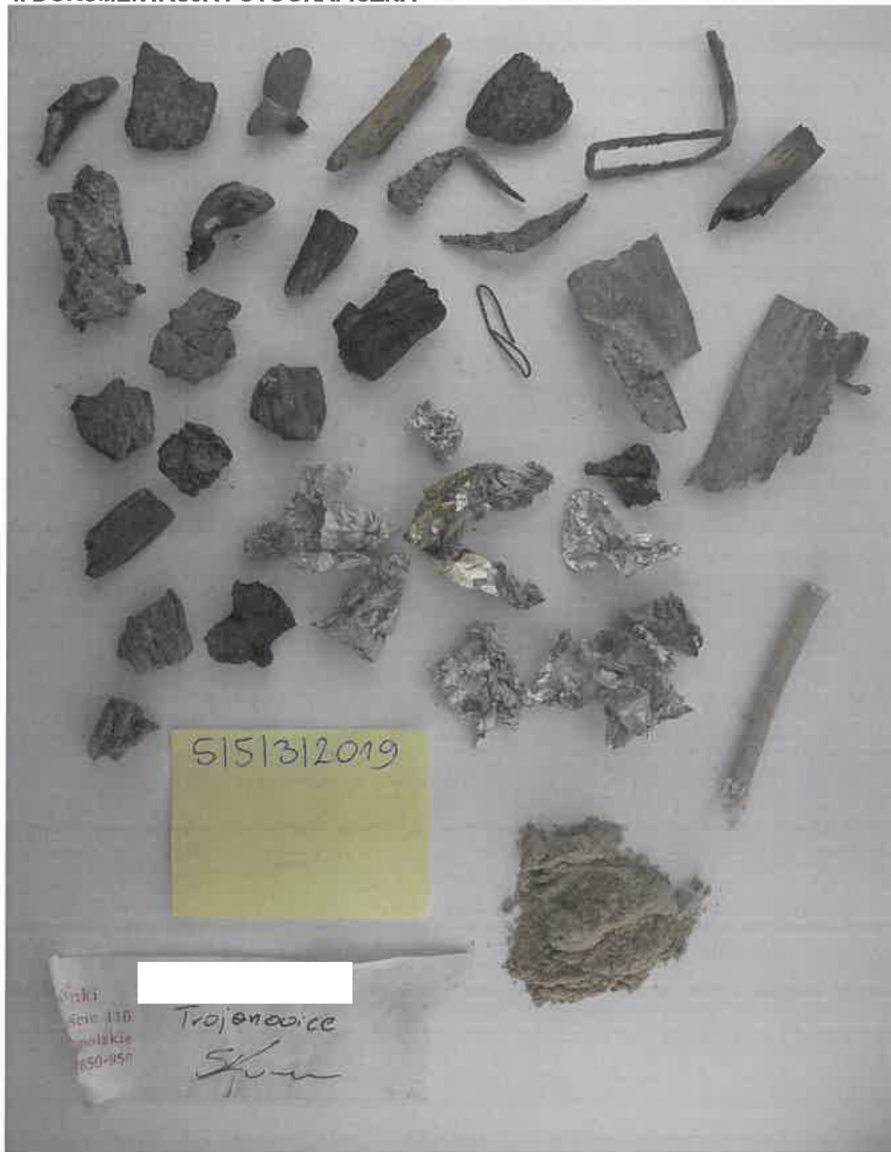
Rys. 1. Ogólny widok badanej próbki.