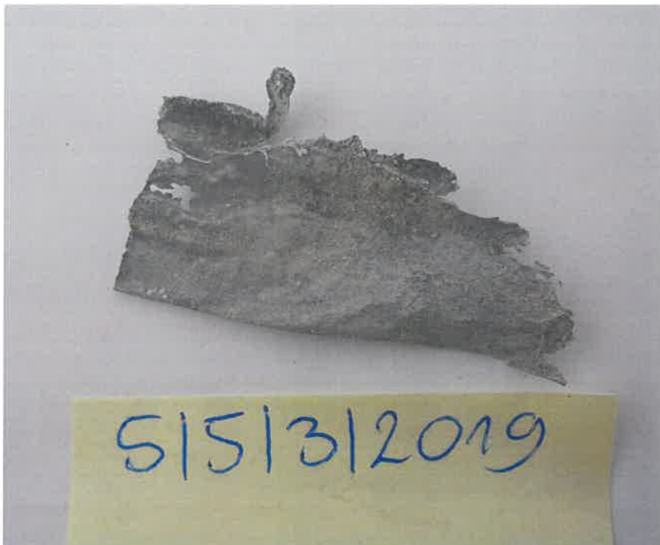
Rys. 3. Metalowa blaszka.